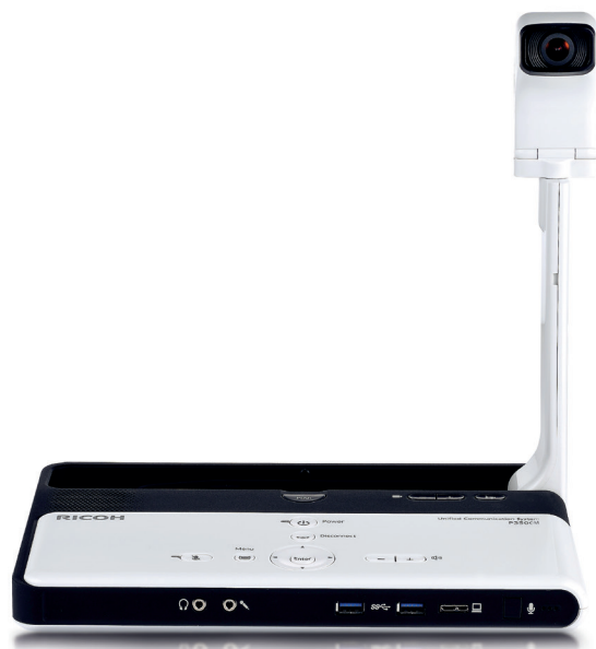
P3500M - Ricohs bærbare videokonferansenhet.